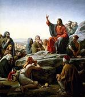
Carl Heinrich Bloch , Il discorso della Montagna

Il cristianesimo riconosce Gesù come il Cristo (Messia) attestato dalla Torah e dalla tradizione ebraica e, nella quasi totalità delle sue denominazioni, come Dio fatto uomo . La teologia cristiana delle principali e più diffuse Chiese cristiane nacque con i primi crediecumenici , come il Credo niceno-costantinopolitano , che contengono dichiarazioni accettate dalla maggior parte dei seguaci della fede cristiana.