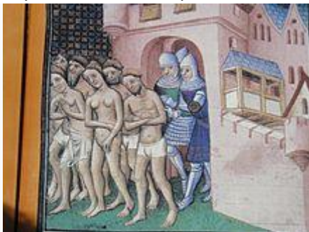
I catari cacciati da Carcassonne nel 1209