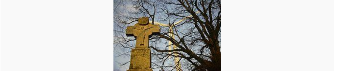
Un crocifisso di pietra in Germania

solo 2005, dati forniti dal CESNUR), 240 milioni di ortodossi, e 275 milioni d'altri), davanti all' islam , che conta 1,5 miliardi di fedeli, e all' induismo , che ne conta 900 milioni.