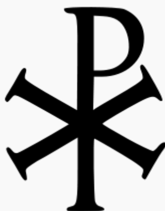
Il Chi Rho rappresenta le due lettere greche con cui inizia il nome Khristòs (Cristo).

La croce è oggi uno dei simboli cristiani più riconosciuti al mondo. Già Tertulliano (160-220) attesta nel De Corona che i cristiani usavano tracciare sopra la fronte il segno della croce :