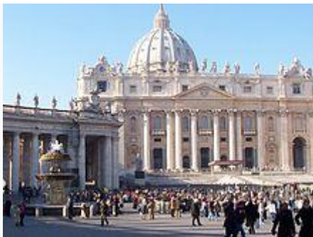
Basilica di San Pietro nello stato della Città del Vaticano

La Chiesa cattolica romana deriva dalla Chiesa latina , la cui autorità si estendeva originariamente da Roma sulla parte occidentale dell' Impero romano . Riconosce il primato di autorità al vescovo di Roma , in quanto, secondo la fede cattolica, successore dell' apostolo Pietro sulla cattedra di Roma .