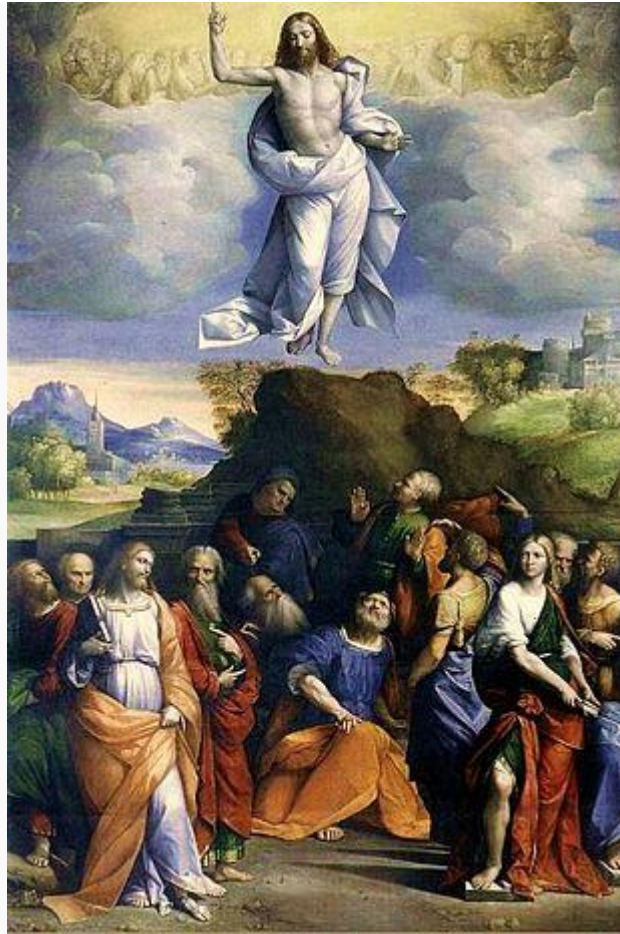
Ascensione di Cristo , dipinto di Benvenuto Tisi da Garofalo , 1510

Il cristianesimo è una religione monoteista a carattere universalistico , originatasi dal giudaismo nel I secolo , fondata sulla venuta e predicazione di Gesù di Nazareth inteso come figlio del Dio d'Israele , incarnato , morto e risorto per la salvezza di tutti gli uomini, ovvero il Messia promesso, il Cristo .