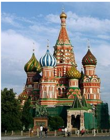
Cattedrale di San Basilio a Mosca

A oriente abbiamo invece le chiese ortodosse , emanazioni delle chiese di lingua greca nate originariamente nel territorio dell' Impero romano d'Oriente . A differenza di quanto accadde in Occidente, per quanto la chiesa greca assumesse rilevanza particolare, essa non fu mai in grado di imporre la propria supremazia sulle chiese "sorelle", che rimasero autocefale . Allo stesso modo, anche le chiese fondate da missionari ortodossi (specialmente fra le popolazioni slave ) si resero rapidamente autonome dalle rispettive chiese-madri, considerandosi allo stesso loro livello. Fra queste la più importante è indubbiamente la Chiesa ortodossa russa .