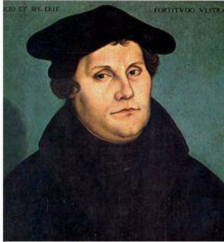
Ritratto di Martin Lutero di Lucas Cranach (1529)

Le chiese della Riforma protestante sono le chiese sorte dalla Chiesa latina nel XVI secolo in seguito alla riflessione teologica di Martin Lutero , Giovanni Calvino , Ulrico Zwingli e altri, nonché dall'appoggio politico e sociale che ebbero dai principi dell'Europa centro - settentrionale. Le chiese protestanti possono venire genericamente suddivise così: