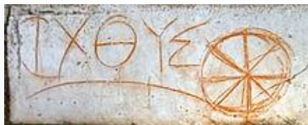
Efeso , scritta ΙΧΘΥΣ